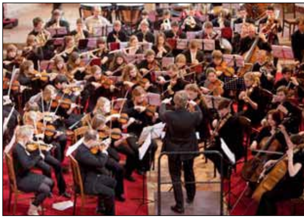
Die Junge Philharmonie im Konzert.

Mit einer Fülle an modernen Klängen, sinfonischen Meisterwerken wie Tschai-kowskys Nussknackersuite