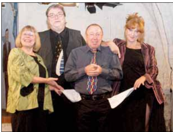
Nichts zu holen beim Kabarett...